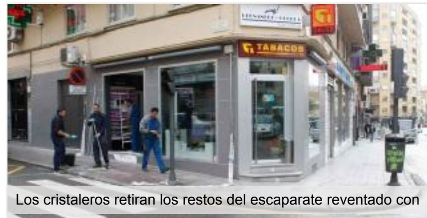
Los cristalereros retiran los restos del escaparate reventado con