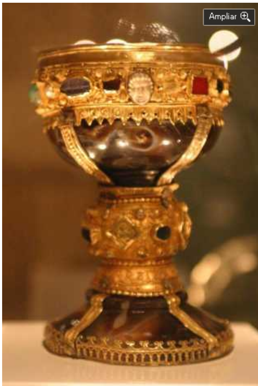
La reina doña Urraca de Zamora donó el Santo Grial a una iglesia de León

Desde Jerusalén, la pieza pasó de mano en mano como regalo para estrechar lazos entre califas y emires hasta llegar a las de Fernando I, principal benefactor junto a su mujer del templo leonés donde se custodia hoy el valioso cáliz, y donde está enterrado el matrimonio y la valerosa reina medieval zamorana.