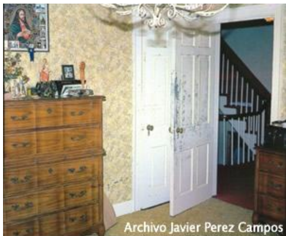
Habitación de la casa.