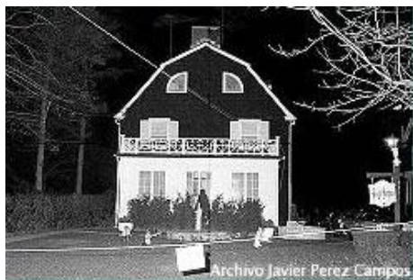
Amityville, con su estructura inconfundible.

Desde el primer día aquella familia sintió que no estaba sola... Escuchaban extraños ruidos, las puertas y ventanas se abrían solas y de vez en cuando aparecían extraños y desagradables olores.