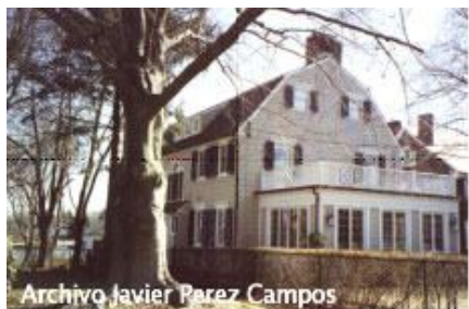
Parte trasera de la casa.

La familia Lutz se mudó al lugar el 28 de de Diciembre de 1974... La casa era realmente bonita; una arquitectura atípica pero elegante a su vez. Además muy espaciosa, y lo que más llamó la atención a los Lutz... bastante barata.