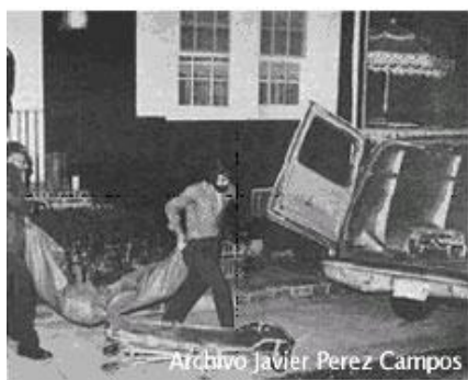
La noche del asesinato de los DeFeo.

Ronald DeFeo había aprovechado la cena para introducir en ella un veneno muy tóxico que produce estados de somnolencia, y cuando todos están durmiendo, coge una escopeta del calibre 34 y los asesina fríamente. A todos les disparó en la espalda, excepto a su madre, Louis DeFeo, a la que dispara sobre el cráneo.