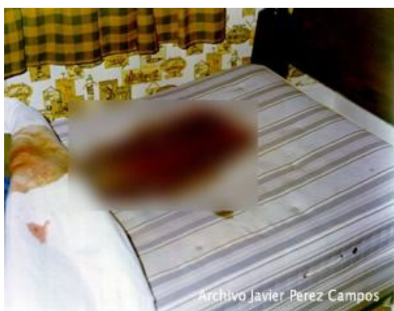
Cama de John DeFeo.