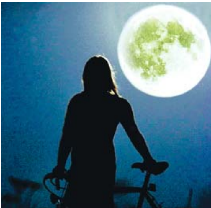
LEYENDAS. Una joven admira una espectacular Luna llena.

yen sobre los partos. «Para nosotros, hubiera sido más bonito confirmar el mito, pero hemos hecho todo tipo de cálculos y comparativas y ha sido imposible. Nacer en creciente o menguante es un fenómeno puramente aleatorio», explicó el especialista Juan Carlos Melchor.